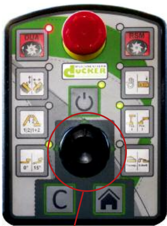
Multistyrenehed med drejekoder