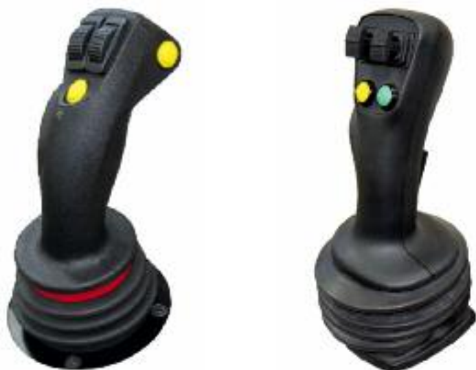
Joystick DUA (fås med hjul eller vippekontakt)

Alle bevægelser af Armklipperen betjenes proportionalt. Med tasterne integreret i joysticket kan du aktivere forskellige funktioner såsom aflastning, flydestilling, Tasttronic, niveauskift eller udstyrsskift.