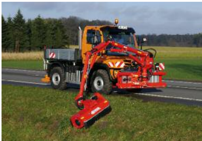
Armklipper DUA 700

Alle komponenter er forbundet med hinanden via et CAN-BUS-system .