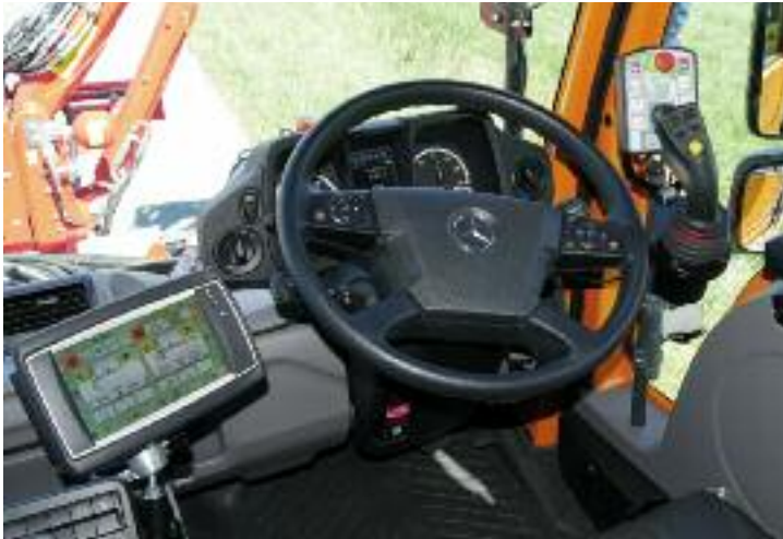
Betjeningsenhed til MK 25 i højre dør