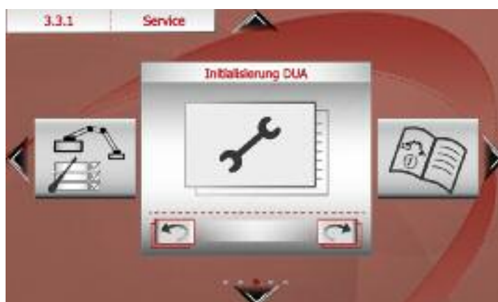
Forvalgsside Service DUA initialisering – rødt menuniveau