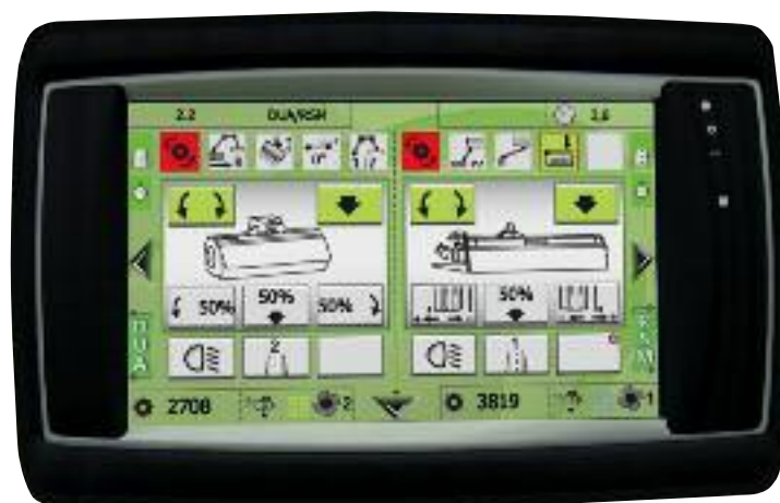
Touchdisplay med visning venstre DUA / højre RSM

Ekstra muligheder som knivakslens omdrejningstal, olietemperaturovervågning, arbejdslygter og ekstra ventilator overvåges og betjenes via displayet.