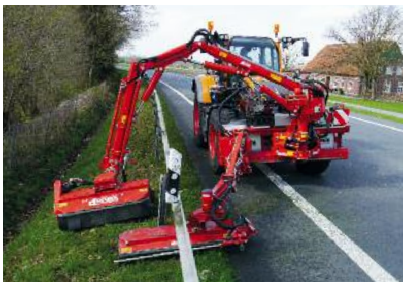
Dobbeltklipper MK 25 / 800